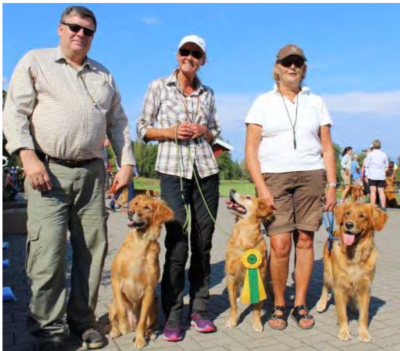
Klubbmästare NKL, EKL och ÖKL