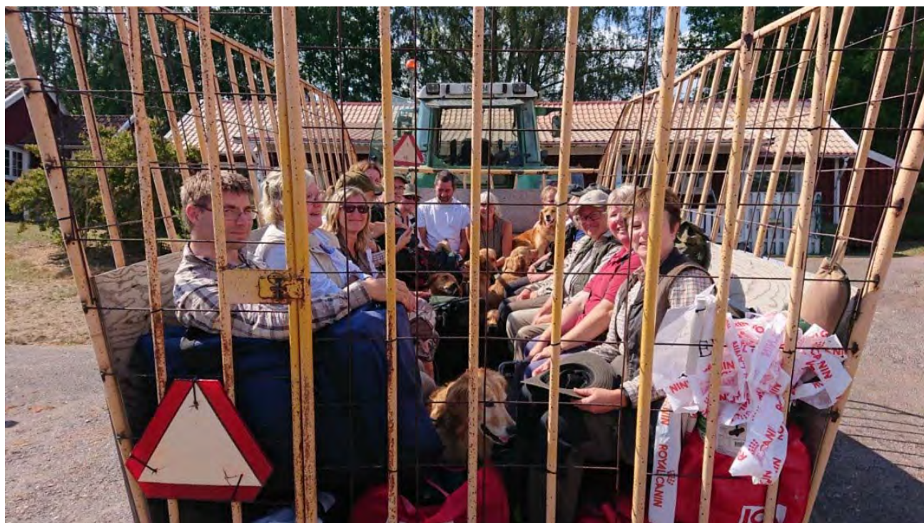
Deltagarna på årets KM fick åka skrinnda ut i skogen för att minimera risken för skogsbrand